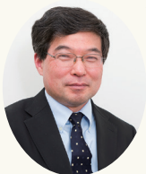
健幸甲子園実行委員長 多摩市医師会会長

今年も「オール多摩! 健幸甲子園」を、より広い団体のネットワークづくりをテーマに、「地域ふれあいフォーラムTAMA」と共に開催いたします。健幸づくりに携わるたくさんの団体のご応募をお待ちしています。